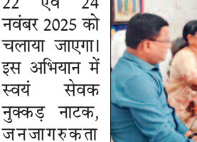
कार्यक्रम अधिकारी के नेतृत्व में स्वयंसेवक ग्राम पंचायत मचवा, भुरका, बरोडा बाजार, लफनिकला में जागरूकता कार्य करेंगे। शांतीबाई कला एवं वाणिज्य महाविद्यालय के